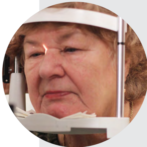
POTILAS VALMIINA SILMIEN BIOMIKROSKOOPPI- TUTKIMUKSEEN

Kostean silmänpohjan ikärappeuman hoidossa on tärkeää muistaa, että sairaus on krooninen, etenevä sairaus, joka vaatii jatkuvaa seurantaa ja säännöllistä hoitoa.