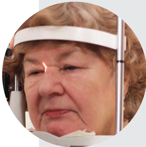
POTILAS VALMIINA SILMIEN BIOMIKROSKOOPPI- TUTKIMUKSEEN

Kostean silmänpohjan ikärappeuman hoidossa on tärkeää muistaa, että sairaus on krooninen, etenevä sairaus, joka vaatii jatkuvaa seurantaa ja säännöllistä hoitoa.